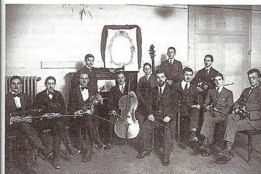
Das Orchester Gelterkinder im Gründungsjahr 1916.

Das Orchester Gelterkinder feiert seinen 100. Geburtstag nicht nur mit drei grossen Konzertprojekten, sondern veranstaltete zum Jubiläum auch einen Festakt mit zahlreichen Rednern und gab eigens eine Festschrift heraus.