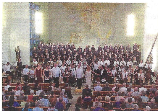
Das Orchester Gelterkinder mit dem Männerchor Gelterkinder und dem Zofinger Stadtchor beim Jubiläumsauftritt in der Katholischen Kirche Gelterkinder im Juni 2016.

Das Jubiläumsjahr 2016 wurde mit zwei fulminanten Neujahrskonzerten im Stil der Wiener Philharmoniker eröffnet. Mit den Auftritten des Orchesters Gelterkinder, gespickt mit Balletteinlagen der BBL Tanzboutique,