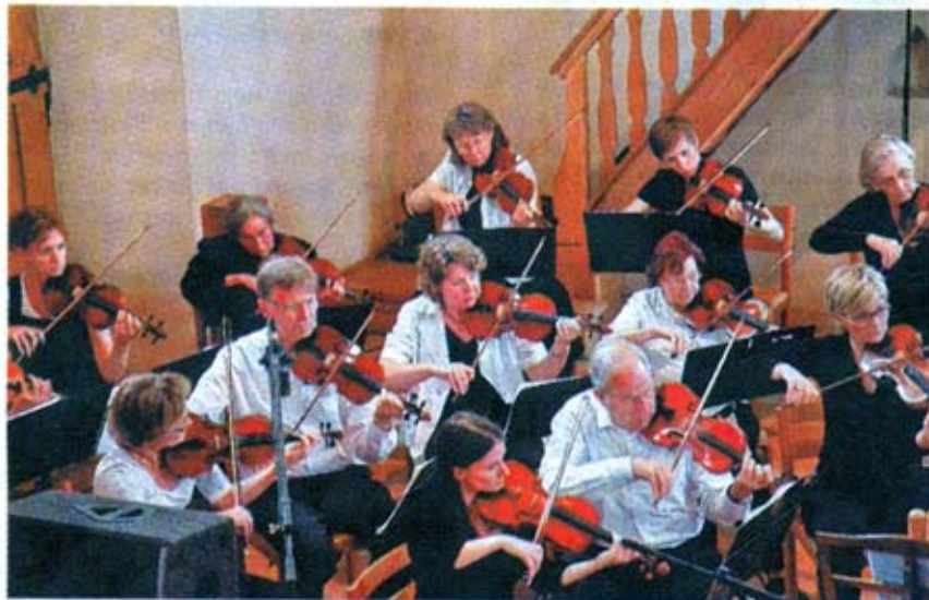
40 Musiker, die an einem Strick ziehen: Das Orchester Gelterkinden in seinem 94. Jahr.

wäre der Kesselpauke (den Jägern) wiederum entkommen. So aber wurde Peter zum Helden eines ganzen Dorfes. Nur das Fagott (der Grossvater), das will der Sache auch während des abschliessenden Umzugs nicht so ganz trauen. «Was wäre wenn», bleibt seine Frage.